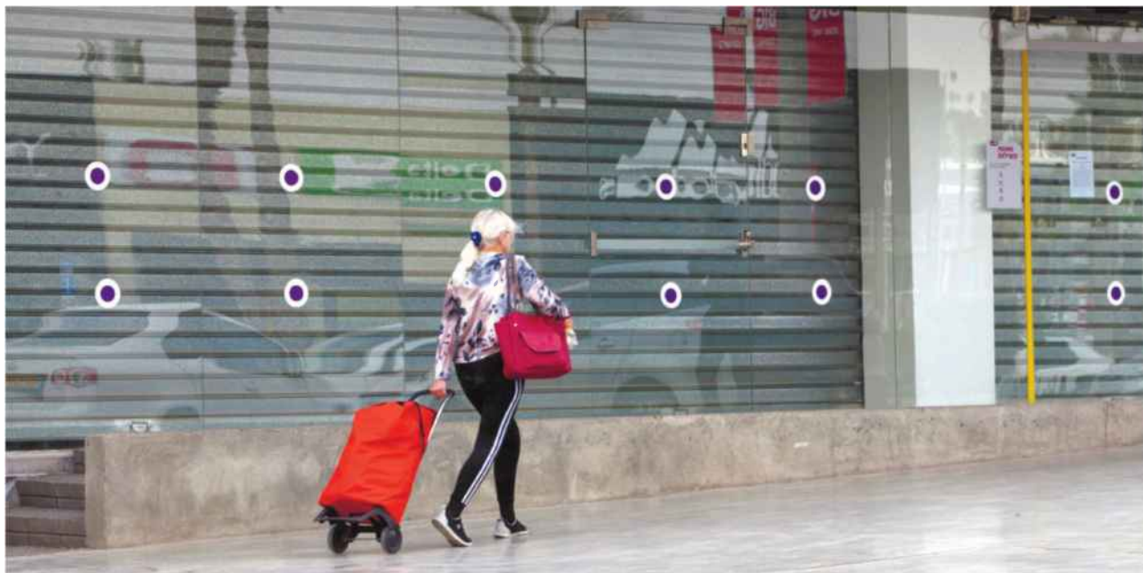
קניון ביג באר שבע. משבר הקורונה פוגע בעיקר בנכסים מסחריים

האם כל הנכסים יושפעו באופן דומה? להערכתו של מסילתי הסיכון לירידת שווי גבוה יותר בשוק המשרדים והנדל"ן המסחרי מאשר במגזר המגורים. "באופן מסורתי שוק המשרדים מציע למשקיעים תשואה גבוהה יותר ותשואה גבוהה כרוכה ברישק כלל בסיכון גבוה. עם זאת, לא כל דחייה בתשלומי שכר דירה צריכה להיחשב כאובדן הכנסה הפוגע בערך הנכס",