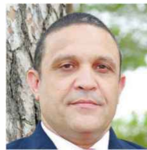
חיים מסילתי

משבר הקורונה מכה בע"נ הנדל"ן גם בחזית השמאית, ובענף הוששים בימים אלה מירידה דרמטית בהערכות השווי השמאיות – בעיקר של נכסים מסחריים להשקעה. הערכות השווי צפויות להתערבן בעוד כמה שבועות, לאחר חג הפסח.